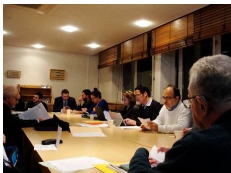
L'AG au travail.

Après la présentation du bilan d'activité, nous avons examiné le rapport d'orientation. La volonté d'associer l'ensemble des générations de l'UNEF, aux événements de notre association est exprimée unanimement. Quelques thématiques comme les œuvres universitaires, la représentation étudiante et d'autres permettent cette approche.