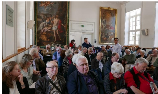
Le 19 mai 2018: une salle pleine.

Plusieurs thèmes sont abordés mais seront traités ultérieurement :