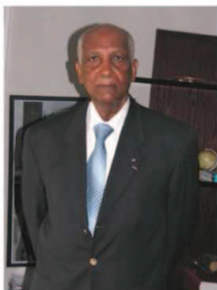
De l'UNEF au Sénat en passant par les cinquante années de gestion municipale

ANCIEN SÉNATEUR ET MAIRE DE POINTE-À-PITRE SOIXANTE ANNÉES D'ENGAGEMENTS POLITIQUES